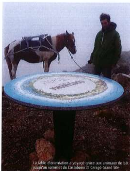
La table d'orientation a voyagé grâce aux animaux de bât jusqu'au sommet du Costabona

+ d'infos : didier.brazeau@canigo-grandsite.fr