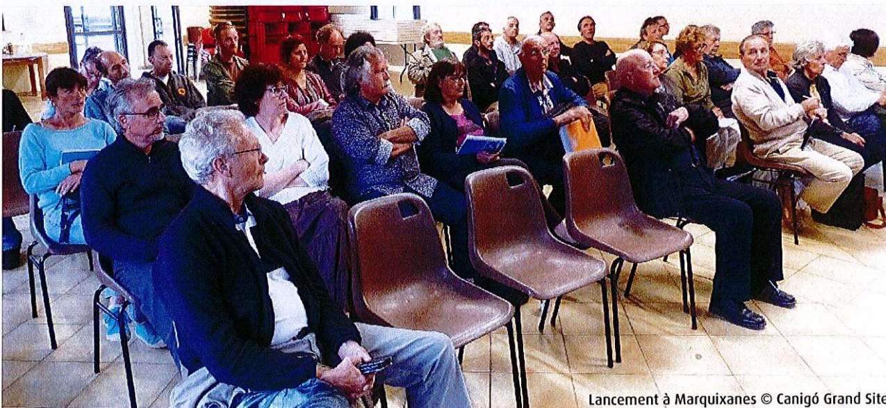
Lancement à Marquixanes

+ d'infos : alain.gensane@canigo-grandsite.fr