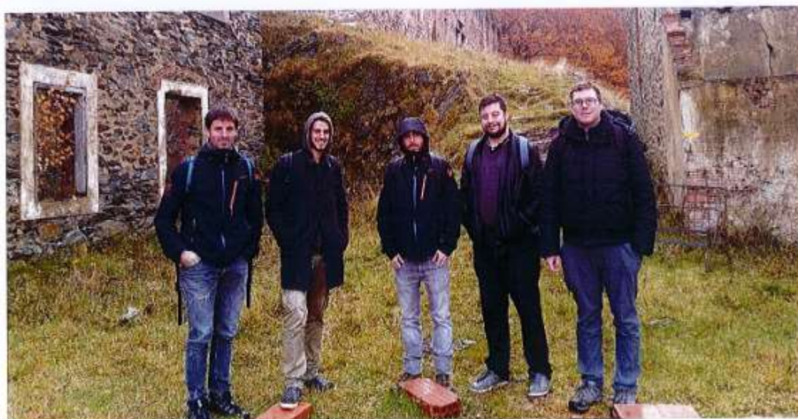
Avec les financeurs (Région Occitanie et Gal Terres romanes) sur le site de la Pinosa. Etat, Département et Gal Pyrénées-Méditerranée se sont excusés

+ d'infos : ruben.molina@canigo-grandsite.fr